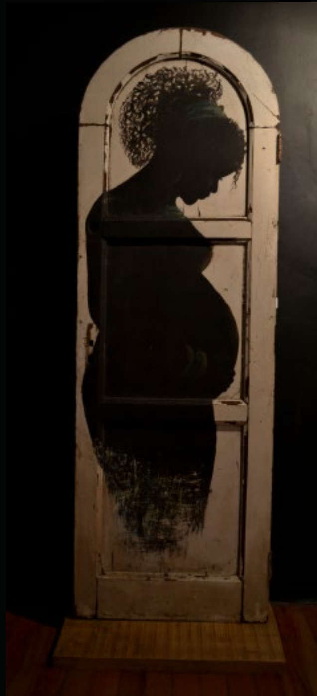
TITLE: Nojotro (us) DIMENSIONS: 80 cm x 1.90 cm TECHNIQUE: Mixed acrylic and pastel on metal YEAR: 2020