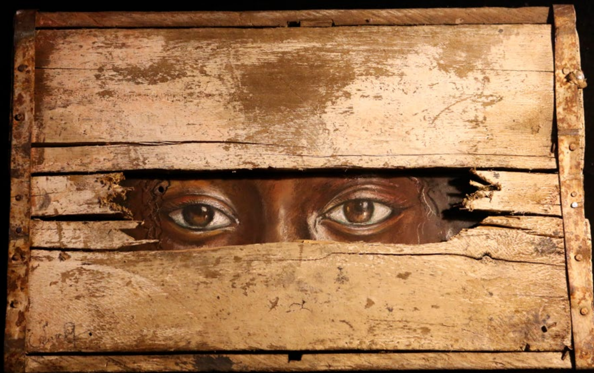
TITLE: Silence DIMENSIONS: 37cm x 27 cm TECNIQUE: Mixed acrylic and pastel on metal installed on wooden boxes. YEAR: 2021