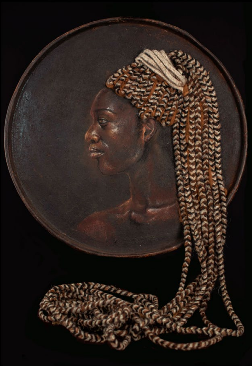
TITLE: Flaky DIMENSIONS: Diameter 60cm with 1.10cm length of the strings. TECNIQUE: Mixed acrylic and pastel on metal YEAR: 2019