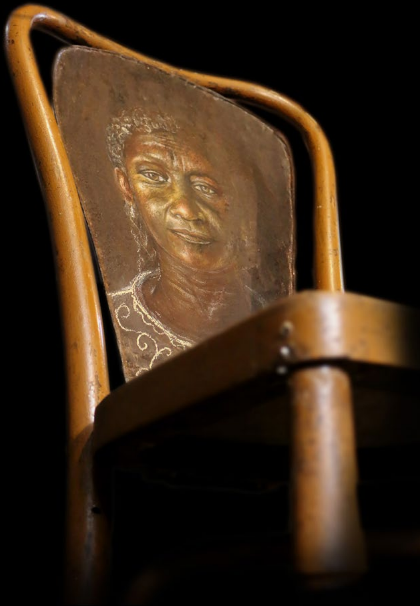
TITLE: Muse DIMENSIONS: 40cm x 90 cm TECNIQUE: Mixed acrylic and pastel on metal, installed on a chair YEAR: 2019