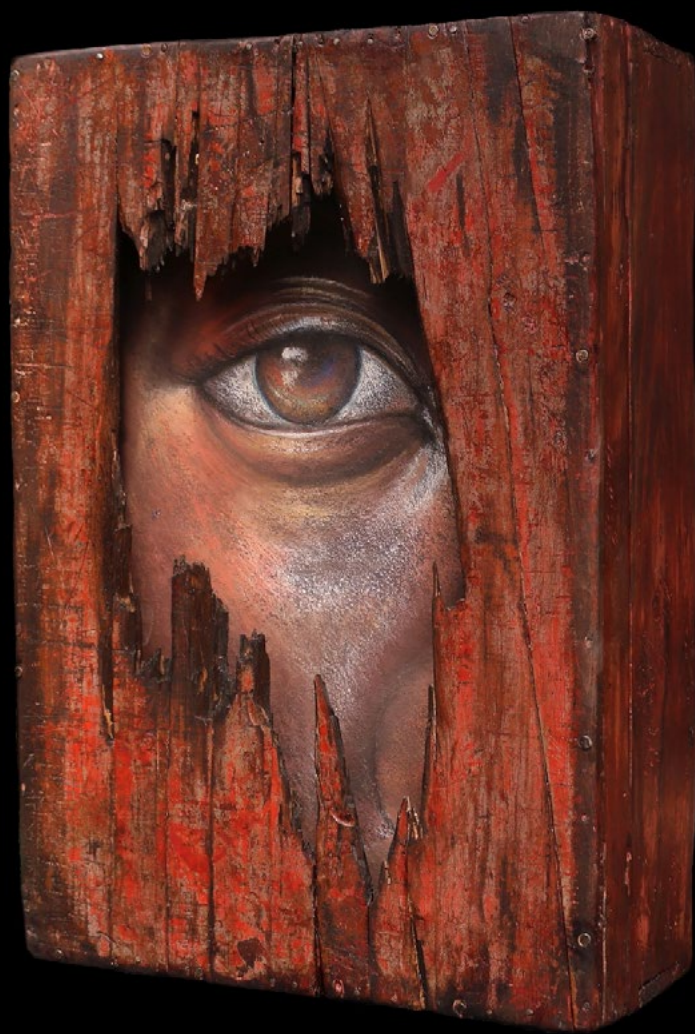
TITLE: Quinturá II (Cut) DIMENSIONS: 49cm x 65 cm TECNIQUE: Mixed acrylic and pastel on metal installed on wooden boxes. YEAR: 2021