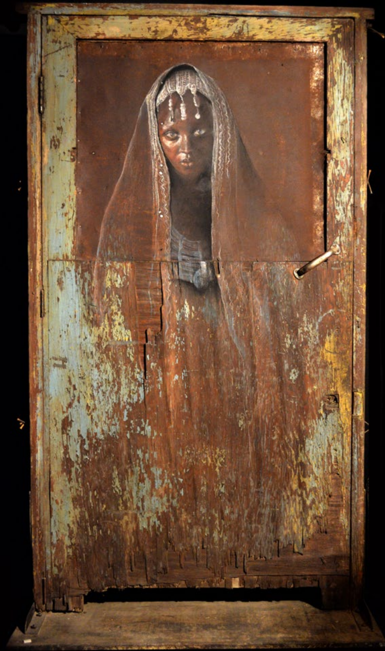
TITLE: Ajayu DIMENSIONS: 1.25 cm x 1.70cm TECHNIQUE: Mixed on metal YEAR: 2014