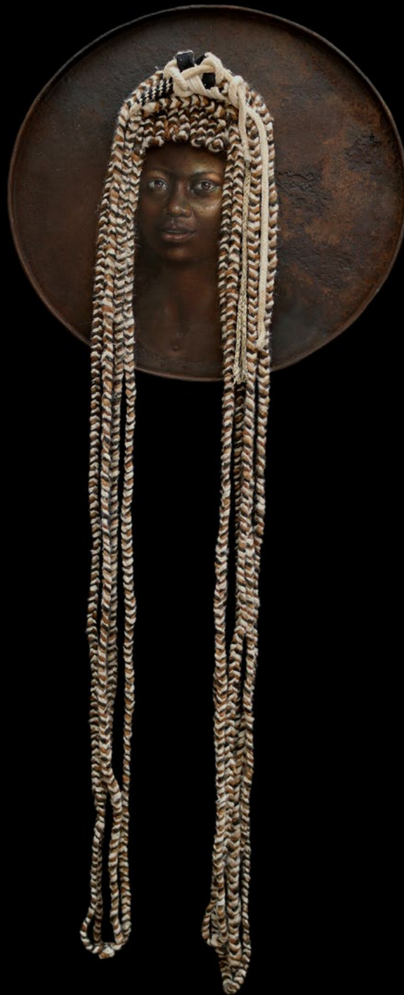
TITLE: Amaya(Soul) DIMENSIONS: Diameter 60cm with 1.60cm of strings TECNIQUE: Mixed acrylic and pastel on metal YEAR: 2021