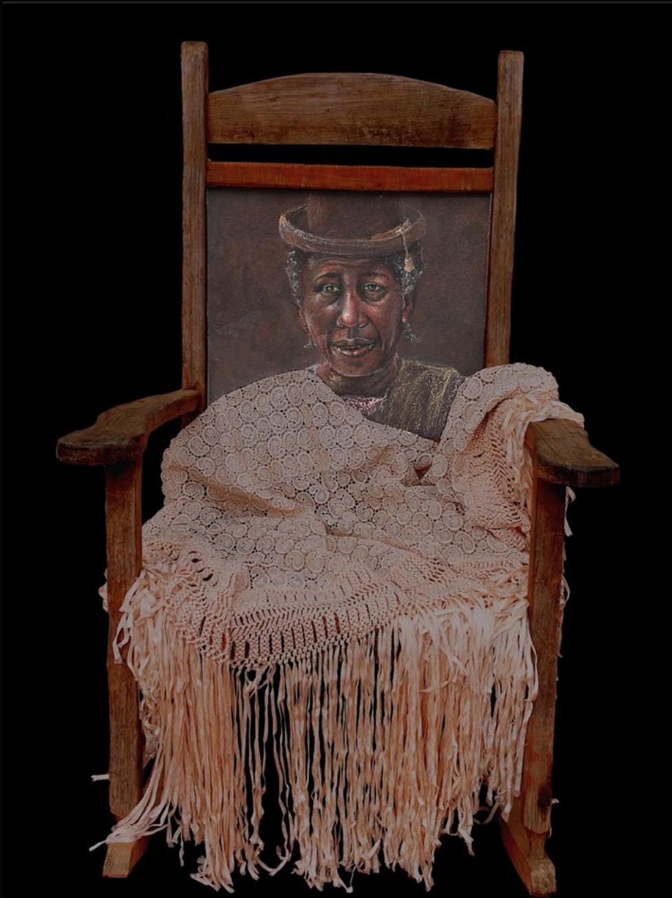
TITLE: Rocking time DIMENSIONS: 66 cm x 1.10cm TECNIQUE: Mixed acrylic and pastel on metal YEAR: 2021