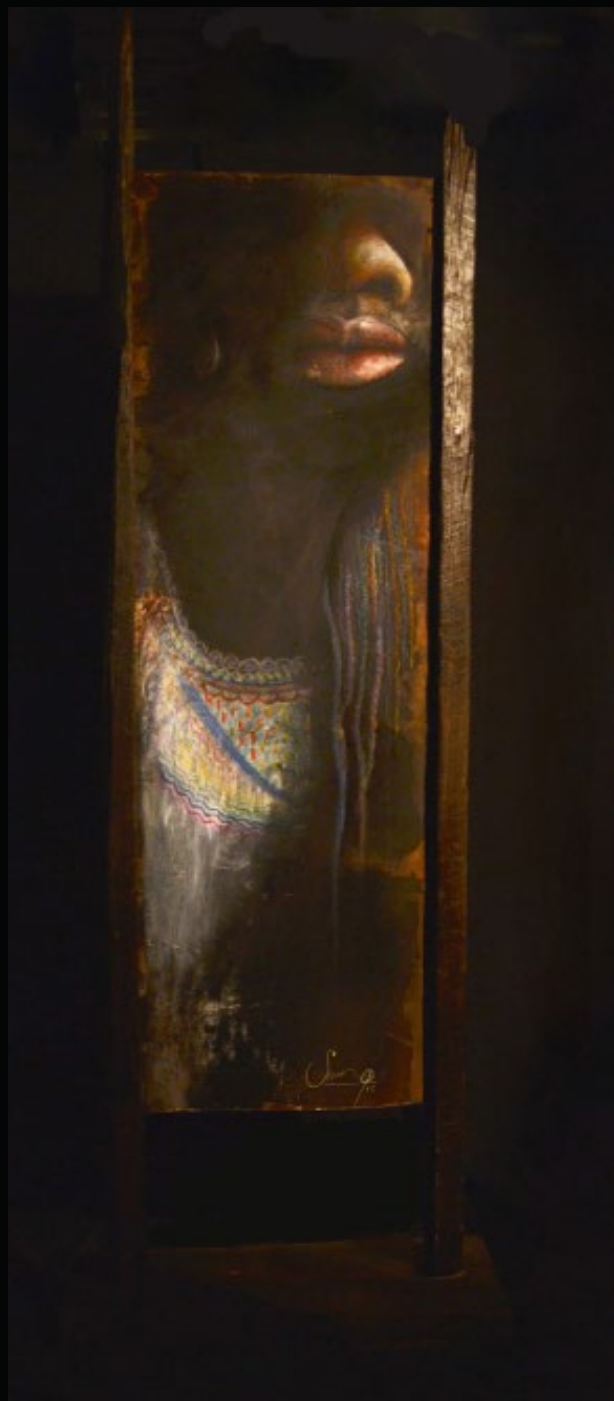
TITLE: Dadiva DIMENSIONS: 80 cm x 1.80cm TECHNIQUE: Mixed YEAR: 2015