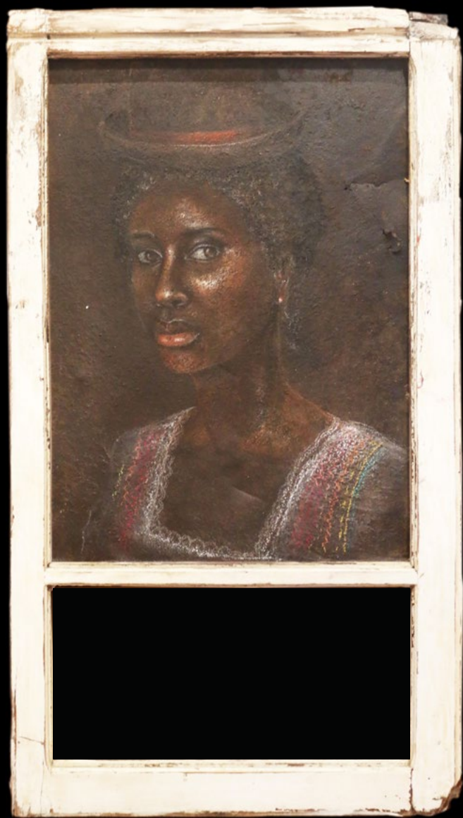
TITLE: Janchirá (DESOLATED SCREAM) DIMENSIONS: 51 cm x 1.12cm TECNIQUE: Mixed acrylic and pastel on metal YEAR: 2021