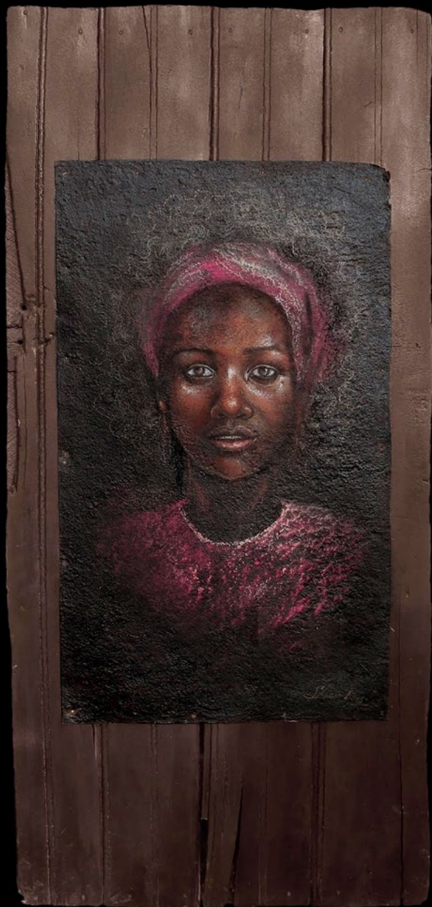
TITLE: Encanto DIMENSIONS: 51 cm x 1.12cm TECNIQUE: Mixed acrylic and pastel on metal YEAR: 2020