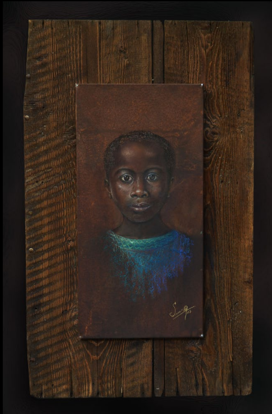
TITLE: Aquele (that) DIMENSIONS: 53cm x 98cm TECHNIQUE: Mixed acrylic and pastel on metal YEAR: 2017