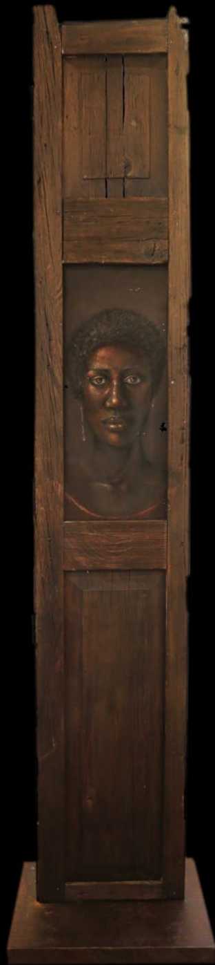
TITLE: Lauti (Lauti tall thin person) DIMENSIONS: 46 cm x 2.68 cm TECNIQUE: Mixed acrylic and pastel on metal YEAR: 2020