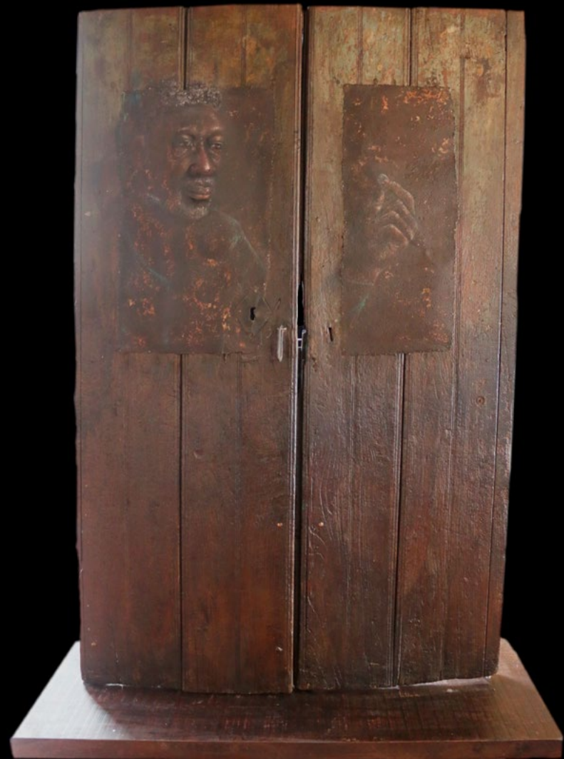
TITLE: It's worth a Potosi DIMENSIONS: 1.09 cm x 1.70cm TECNIQUE: Mixed acrylic and pastel on metal on a potosinian door with hand wrought iron from 1940 YEAR: 2019